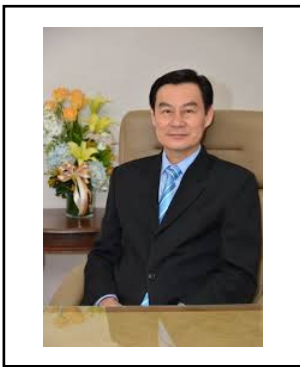
นายอุดม วงศ์วิวัฒน์ไชย เลขาธิการคณะกรรมการส่งเสริม การลงทุน (บีโอไอ)

อย่างไรก็ตาม นอกจากนี้ สมอ.กำลังเตรียมทำประชาพิจารณ์มาตรฐานผลิตภัณฑ์อุตสาหกรรม หมวกนิรภัยสำหรับผู้ใช้จักรยานยนต์เพื่อนำมาประกาศใช้ในสิ้นปีนี้ โดยจะปรับใหม่ให้เป็นไปตาม มาตรฐานความปลอดภัยตามข้อตกลงประเทศในกลุ่มอาเซียนหรือมาตรฐานยูเอ็นอีซีอี ขององค์การ สหประชาชาติ (ยูเอ็น) จากปัจจุบันที่ไทยใช้มาตรฐานความปลอดภัยของประเทศญี่ปุ่น ซึ่งมาตรฐานใหม่ จะทำให้หมวกนิรภัยมีความแข็งแรงมากขึ้น และสามารถส่งออกสินค้าไปจำหน่ายยัง 10 ประเทศใน อาเซียนได้ตามข้อตกลง