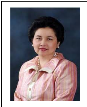
ดร.อรรชกา สีบุญเรือง อธิบดีกรมส่งเสริมอุตสาหกรรม

1. กสอ.สร้างความแข็งแกร่งให้อุตสาหกรรมพัฒนาขอนแก่น กลายเป็น 'ฮับ' รองรับเออีซี (ที่มา: หนังสือพิมพ์เดลินิวส์, ประจำวันที่ 28 กรกฎาคม 2557)